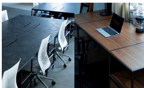
左／オーバーレイ天板デスク 右／通常の連結デスク