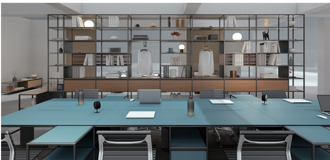
Tesera Wardrobe を組み込んだシェルフとオーバーレイ天板の連結デスクのイメージ ※仕様は変更になる可能性があります